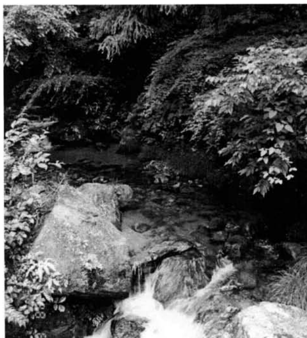
矢作川支流の坪崎川源流部 (1998年6月2日)