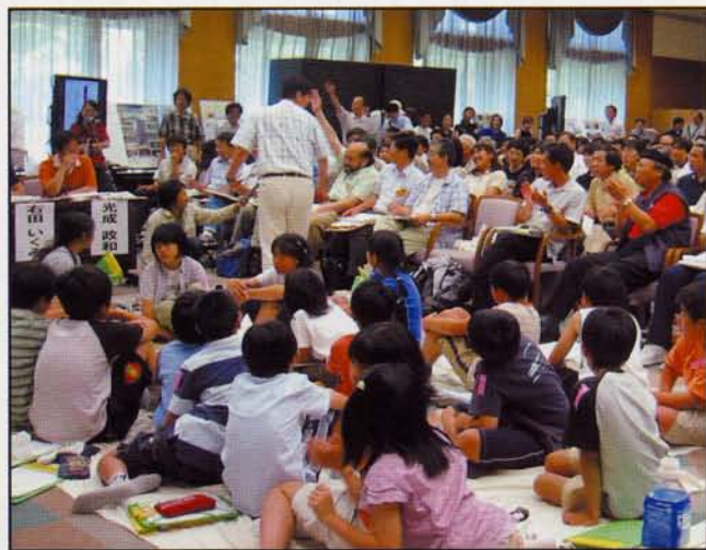
第7回 二次選考会のようす