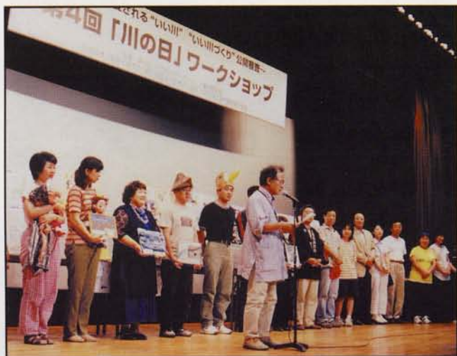
第4回 表彰式グランプリ