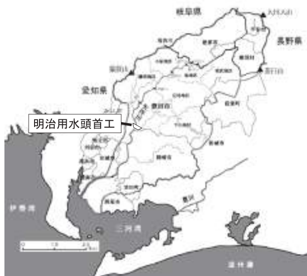
図1 明治用水頭首工の位置。

なお、2016年と2020年は左岸魚道で耐震工事が行われたため、右岸寄りのゲートから放水して右岸魚道で目視による観測をおこなった。目視による計数方法は、右岸魚道内の上流端の段差の部分で、10分間隔で遡上する個体数を記録した。調査の時間帯は8時から18時ま