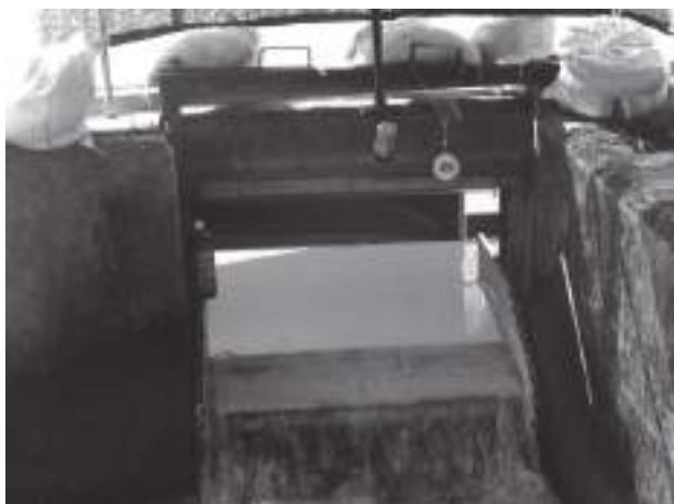
計数部分に設置した板。