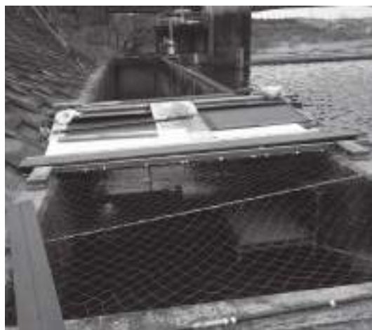
光条件を整えるために屋根を設置。