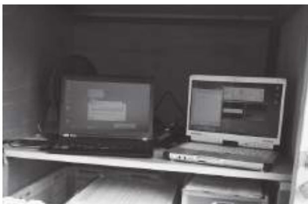
設置したパソコン（右側が計数用，左側が録画用）。