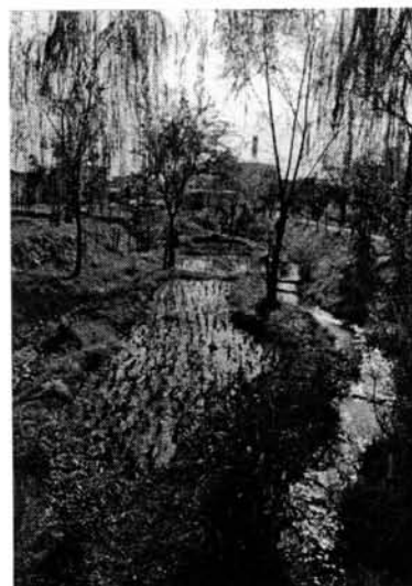
児ノ口公園内の五六川と水田