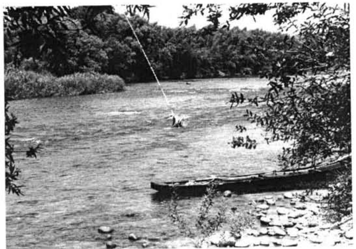
古巣水辺公園 — 夏・アユ釣り調査