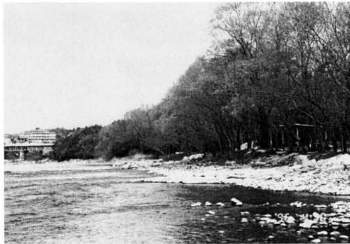
古巣水辺公園 — 春・ヤナギ林の芽吹き