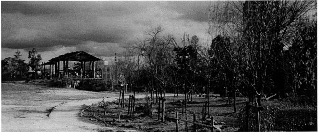
児ノ口公園 (豊田市久保町)