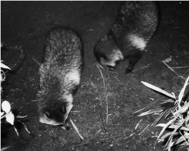
写真2 タヌキ (④西広瀬).