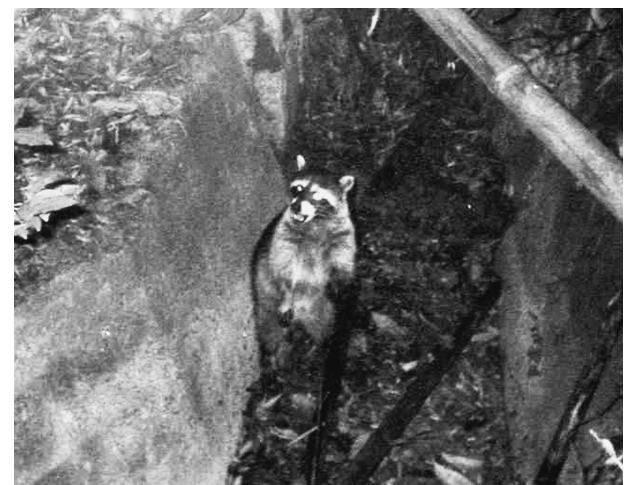
写真1 アライグマ(⑤東広瀬)。