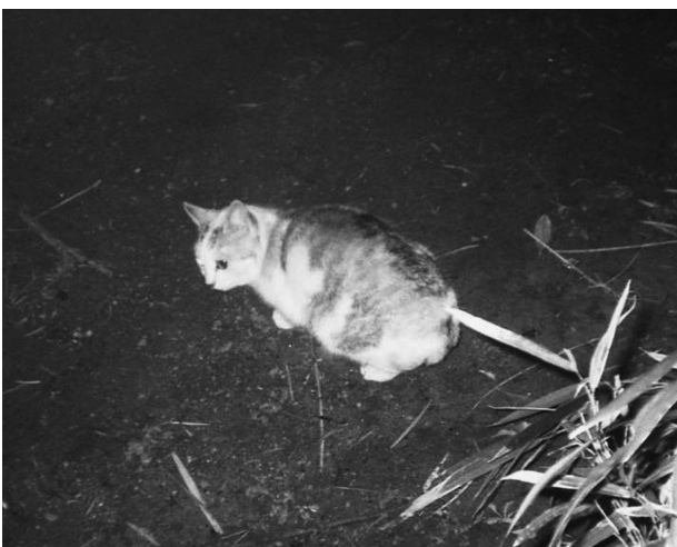
写真4 ネコ (④西広瀬).

Cervus nippon とカモシカ Capricornis crispus を区別することはできなかった。食跡で中・大型哺乳類を確認することはできなかった。