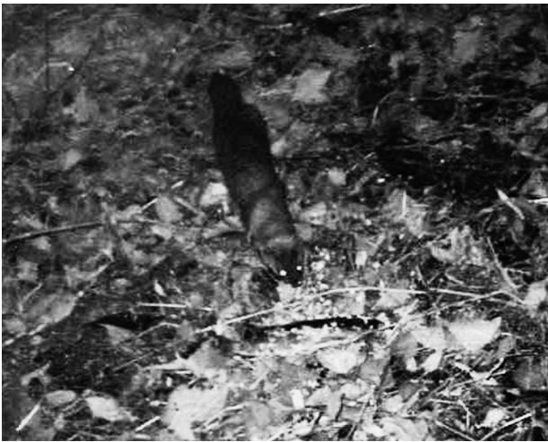
写真3 イタチ類の一種 (①小渡).