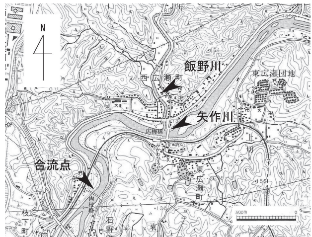
図1 調査地点。国土地理院（1997）豊田北部1/25000.

水質汚濁調査は、矢作川本流の地点は広梅橋上流の右岸、飯野川は中橋上流の左岸、飯野川合流後は両枝橋上流右岸の3カ所で実施されている（図1）。児童が毎朝の登校途中、午前7時30分頃から採水、河川水を学校に持ち帰って透視度計で測定している。調査開始当時は、30 cmの透視度計を用いたが、1978年に100 cm、2003年には150 cmの透視度計へと移行された。