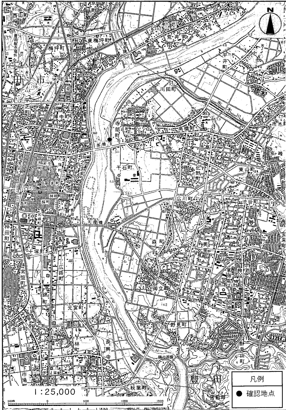
図-2 哺乳類確認地点 (カヤネズミ)