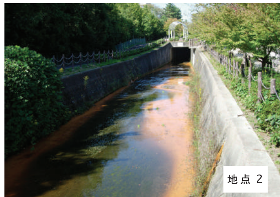
図3-1 調査地点の写真。