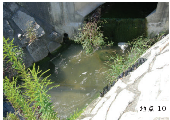
図3-2 調査地点の写真。